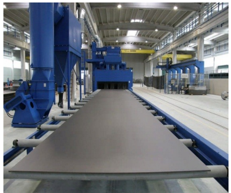
(камеры окраски и дробеочистки)