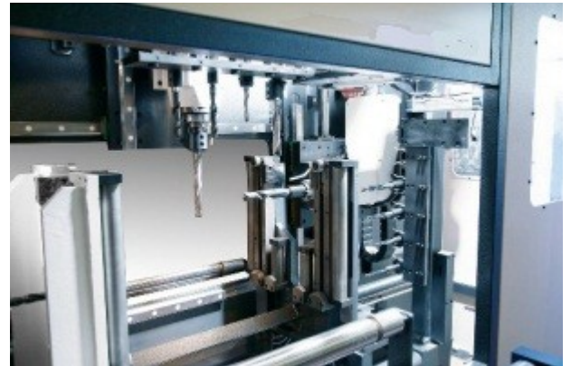
(линия сверления и отрезки балок)