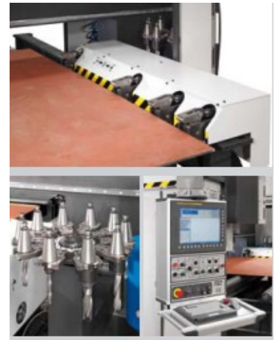
(линия сверления и раскроя листа)