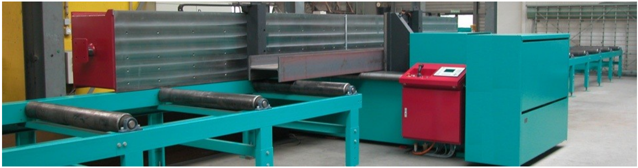
(горизонтальный гидравлический пресс для правки балок)